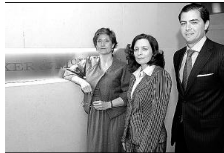
Los principales responsables del área financiera del despacho.